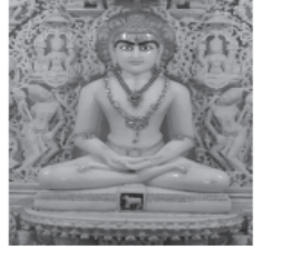
॥ શ્રી વાસુપુજ્ય સ્વામિ નમઃ ॥