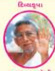
અદ્યાત્મ યોગી આ. ડે. યોમદ વિજય કલાપુર્ણશુભિક્ષરણ મ.સા.