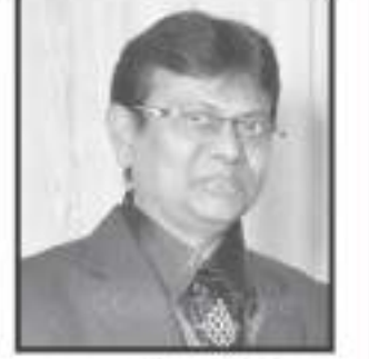
ટ્રસ્ટી - મંત્રી શ્રી જતીન રવજી છેડા (ભચાઉ)