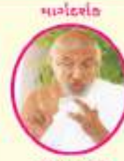
ગણકનાથક પ. પુ. સા. ભ. યોમદ વિજય કલાપુર્ણશુભિક્ષરણ મ.સા.